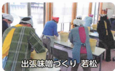
出張味噌づくり 若松