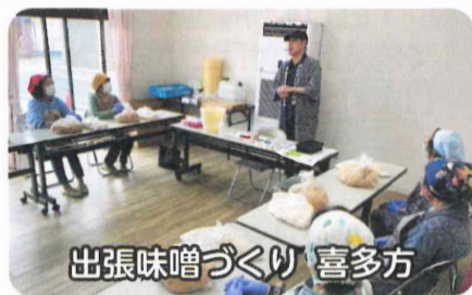
出張味噌づくり 喜多方