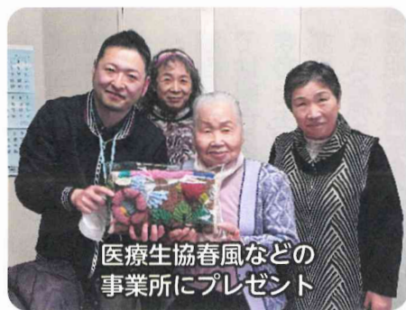
医療生協春風などの事業所にプレゼント