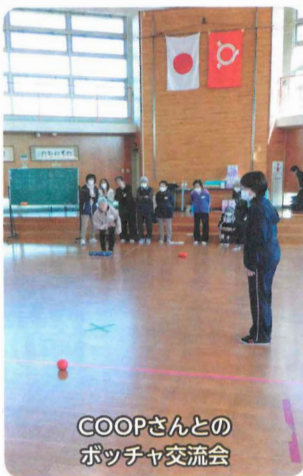
COOPさんとのポッチャ交流会

『すこしお生活』で 健康な毎日を! 塩分のとりすぎは「高血圧」 「動脈硬化」「心筋梗塞」「胃がん」 などの原因になります。 『すこしお生活』とは 【少しの塩分で健やかな生活】