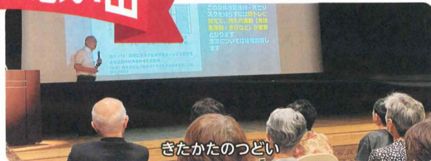
きたかたのつどい