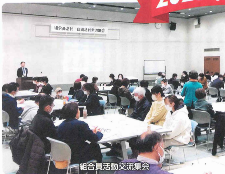
組合員活動交流集会